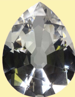
Cullinan I: Der größte geschliffene farblose Diamant der Welt (Nachbildung).

Edelsteine sind Kristalle, die wegen ihrer besonderen optischen Eigenschaften als Schmucksteine verwendet werden. Es werden Replikate des größten jemals gefundenen Diamanten, dem Cullinan, gezeigt sowie Rubine, Aquamarine und Turmaline.