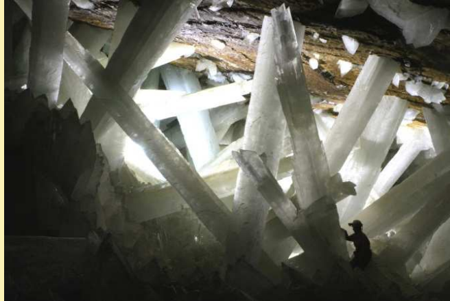
Riesenkristalle (bis 14m lang) in Naica Höhle, Mexiko.

Gips ist ein wichtiger Baustoff zur Modellierung und als Zuschlag im Zement. Es wird erläutert, warum der Gips aus dem Baumarkt eigentlich gar kein Gips ist und wie komplizierte Kristallisationsprozesse aus einer feuchten "Gipsmasse" ein ausgehärtetes Produkt ergeben.