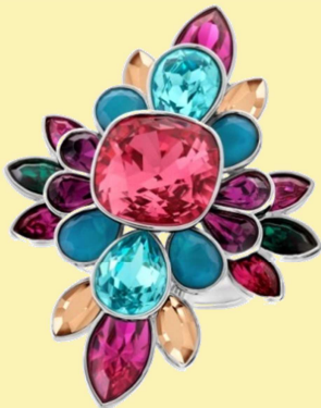
Cardinalring der Firma Swarovski mit bunten Schmucksteinen

Die innere Anordnung der Bestandteile macht den Unterschied: Glas mit einem ungeordneten inneren Aufbau und Kristalle mit strenger innerer Ordnung. Gezeigt werden außergewöhnliche Kristalle aus der Natur und bezaubernde Schmuckstücke der Firma Swarovski.