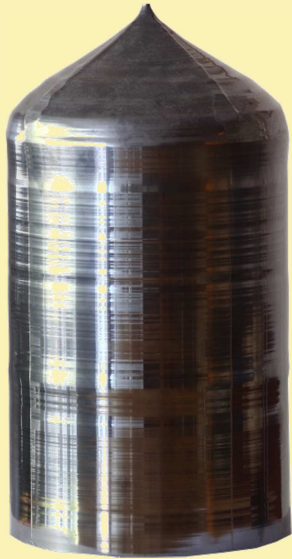
Silizium Kristall zur Herstellung von Wafern (Halbleiterscheiben) für Computerchips

Beeindruckende High-Tech Exponate belegen die Bedeutung kristalliner Produkte für unsere moderne Gesellschaft. Das Knowhow, hochreine Siliziumkristalle zu züchten, ist die Grundlage der Halbleitertechnik. Es wird erklärt, warum man Erdöl durch Kristalle (Zeolithe) leitet, um Benzin herzustellen und wie man diese Kristalle als Waschmittelzusatz nutzt, um ökologisch bedenkliches Phosphat bei der Wasserenthärtung zu ersetzen.