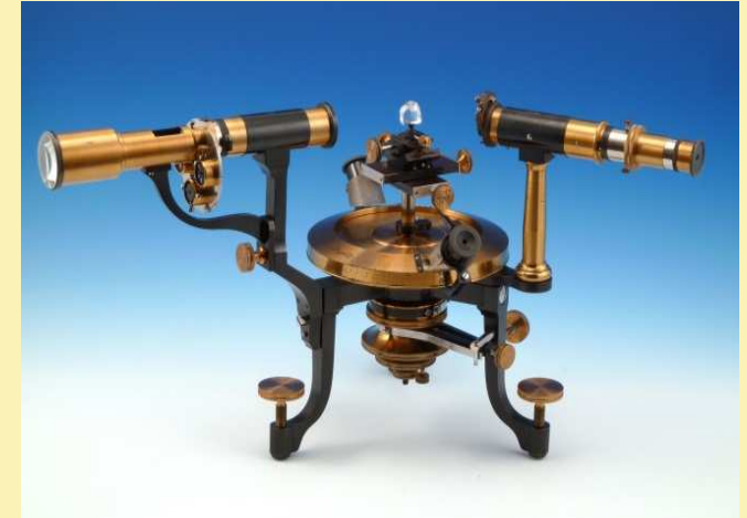
Reflektionsgoniometer der Firma Fuess, Ende 19. Jahrhundert.

Bis zu hundert Jahre alte Geräte zur Untersuchung von Kristallen werden ausgestellt. Früher waren es hauptsächlich Methoden, die sichtbares Licht genutzt haben, doch seit hundert Jahren werden Kristalle primär mit Röntgenstrahlung untersucht.